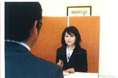
コーディネーターがご要望に合ったお仕事をご紹介します